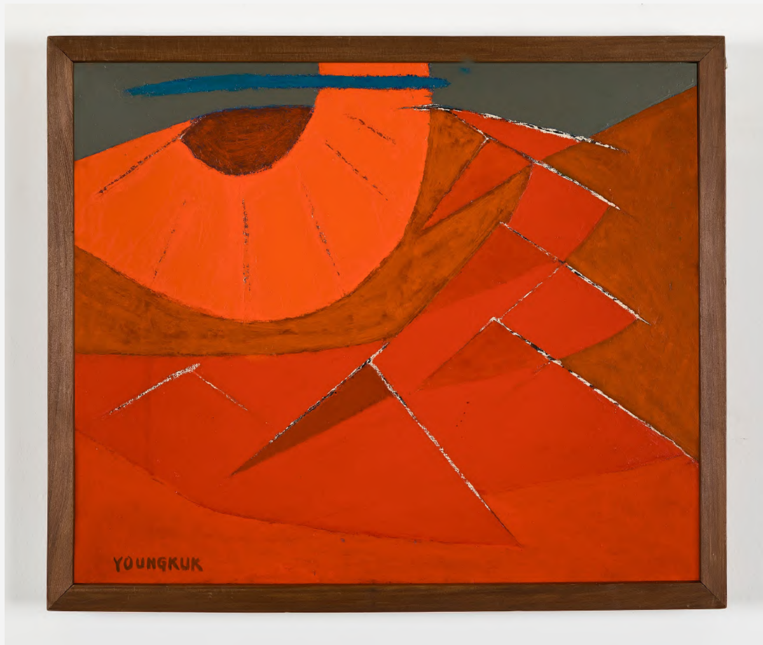
MET DANK AAN GANA ART, SEOUL, LOS ANGELES

Gedomineerd door een levendig rood palet reconstrueert Untitled (1972) beelden uit de natuur via een opeenvolging van geometrische vormen. In het onderste deel van de compositie roept een brede uitgestrektheid bergachtige vormen op, uitgewerkt in vlakken met uiteenlopende toonintensiteit. Scherpe, hoekige lijnen snijden door zachtere, organische krommingen en illustreren zo Yoo's karakteristieke visuele taal. Het werk laat zien hoe de essentie van de natuur wordt onderzocht via de wisselwerking tussen kleur en vorm.