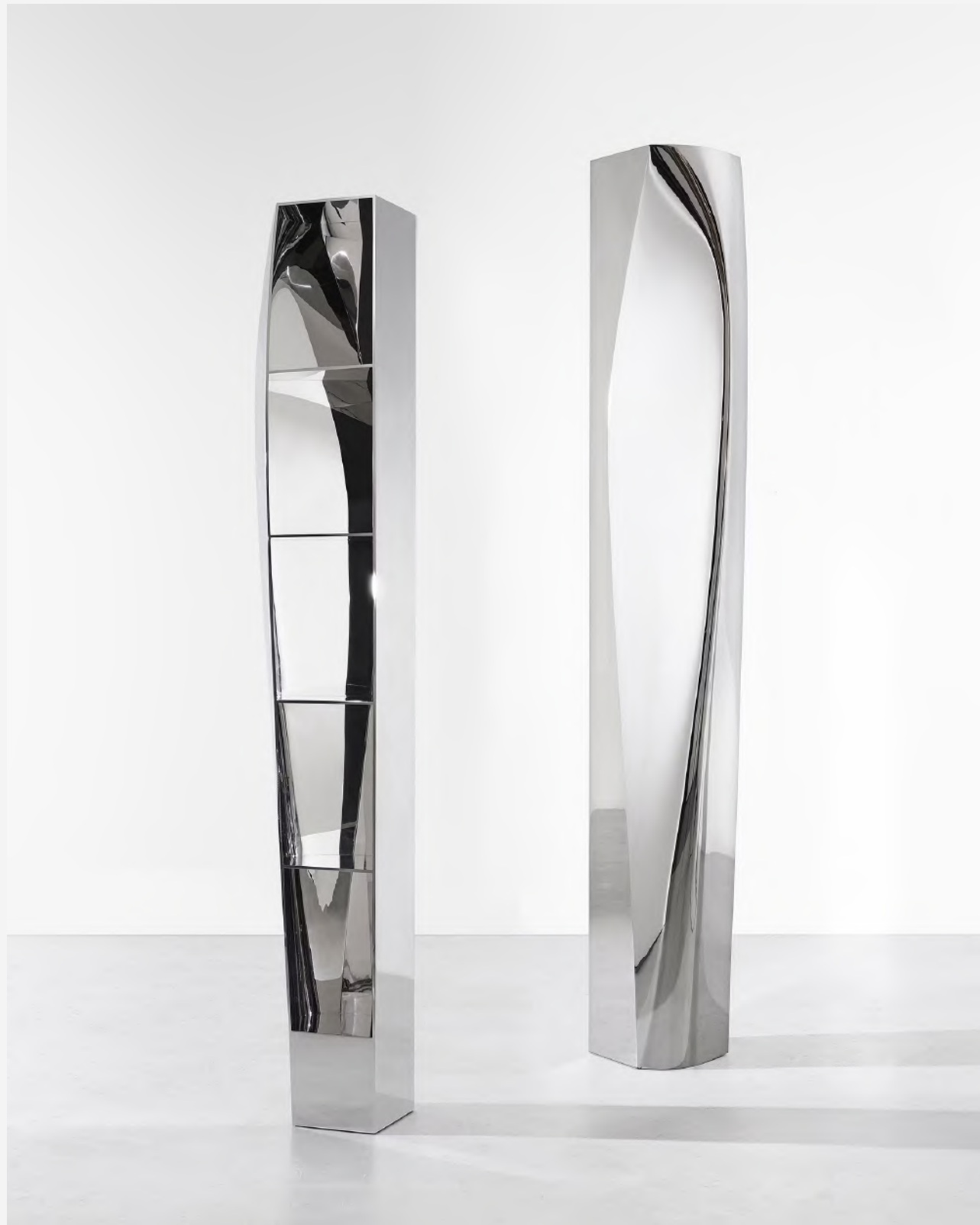
© MARTIN SLIVKA. MET DANK AAN DAVID GILL GALLERY.

Door de verschuivende relatie tussen waarneming en identiteit te verkennen, functioneren deze werken als dragers die de absurditeit van het streven naar perfectie blootleggen, terwijl ze tegelijkertijd de inherente imperfecties erkennen die de menselijke ervaring definiëren. Elk werk gaat een dialoog aan met zijn omgeving en nodigt de toeschouwer uit om zijn eigen spiegelbeeld te confronteren via een speelse maar tegelijk diepzinnige benadering.