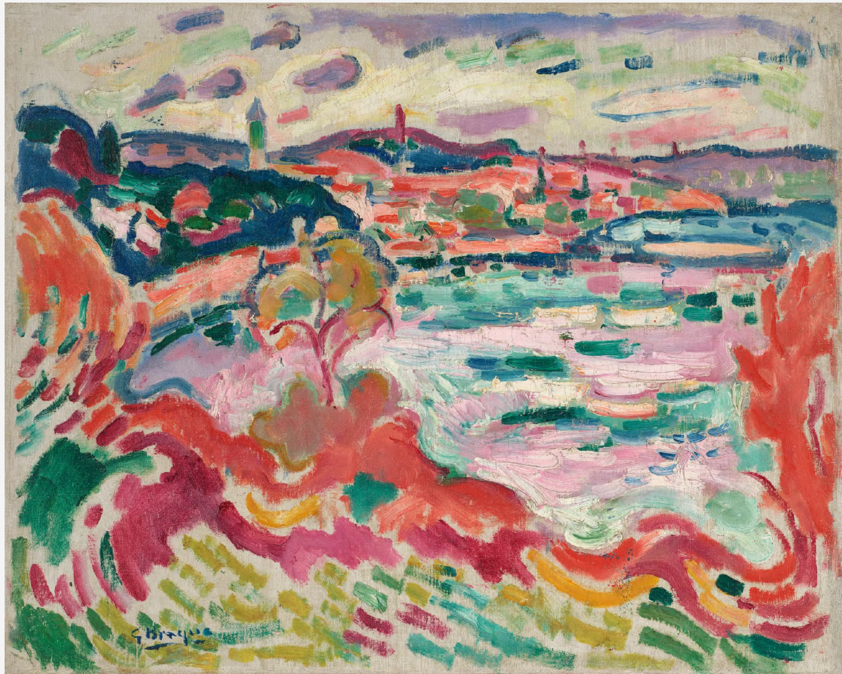
FOTO MET DANK AAN © 2026 ARTISTS RIGHTS SOCIETY (ARS), NEW YORK / ADAGP, PARIS

Georges Braque schilderde L'Estaque tijdens zijn eerste bezoek aan het mediterrane kustplaatsje dat jonge kunstenaars aantrok dankzij het heldere licht van de Provence en de nalatenschap van Paul Cézanne, die tot zijn dood in 1906 in de regio werkte. In deze compositie bouwt Braque voort op Cézannes vernieuwingen — gefacetteerde penseelvoering, verschuivende perspectieven en het gebruik van kleur als structureel middel — om een dynamische en moderne visie op het landschap te creëren.