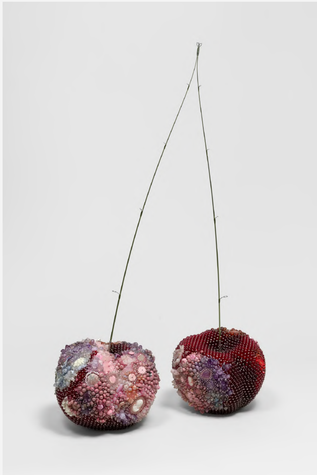
© KATHLEEN RYAN. FOTO: LANCE BREWER. MET DANK AAN GAGOSIAN

Nadat zij vers fruit liet rotten, begon de in New York gevestigde kunstenaar aan een langzaam proces van nabootsing, waarbij zij schimmelplekken opnieuw vormgeeft met duizenden parels, opalen en kristallen, elk afzonderlijk bevestigd met een stalen pin. Dit minutieuze proces verwijst naar de Amerikaanse ambachtelijke traditie van met punaises versierde fruitobjecten. Zoals zichtbaar in Bad Cherries (Princess) resulteert dit in een betoverende rijkdom aan kleur, textuur en oppervlaktespanning, die het onvermijdelijke proces van verval op zowel humoristische als ontroerende wijze esthetiseert.