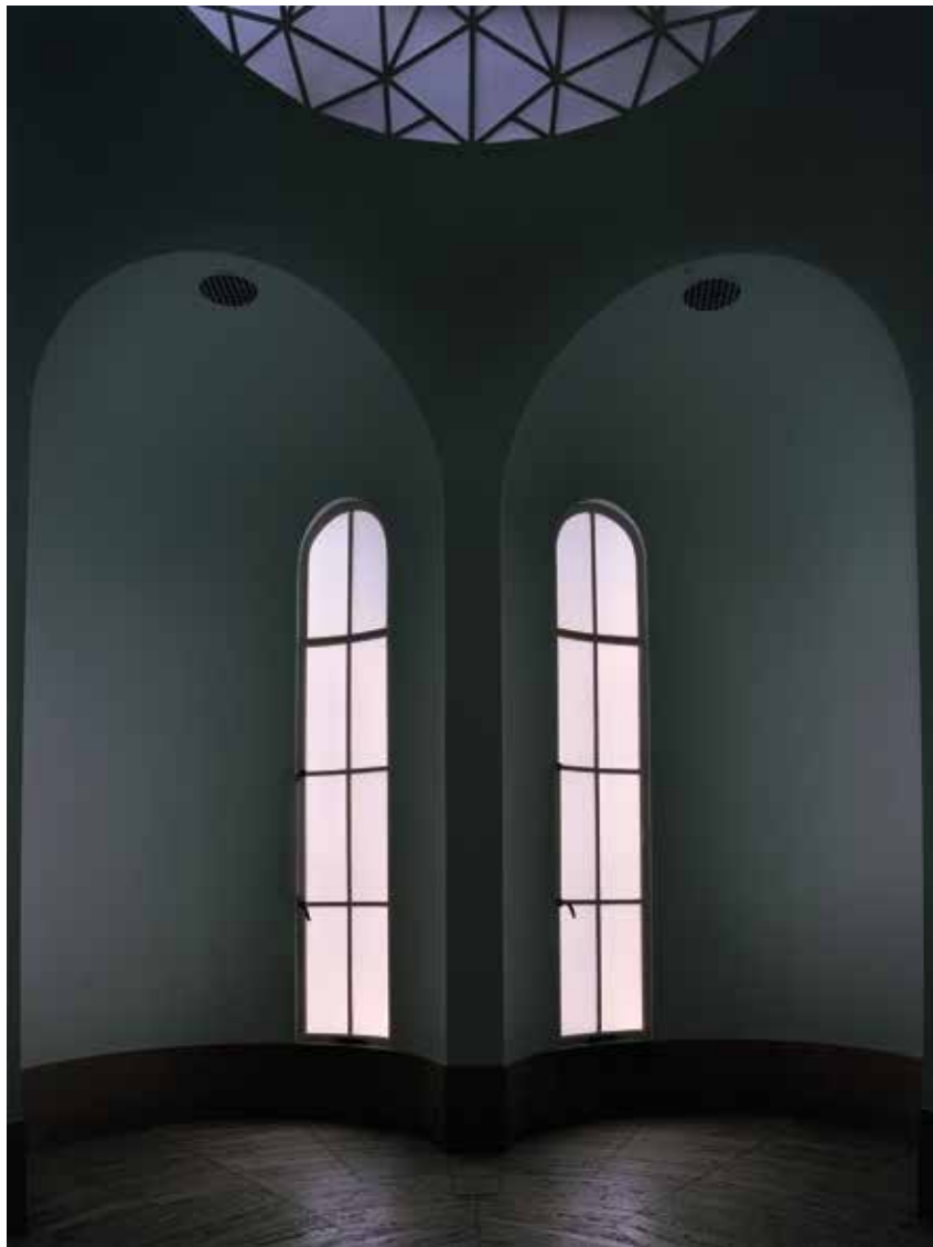
Twilight Zone (Museum Boijmans Van Beuningen) 07, 2020

dat ze niet op het moment zelf kan zien wat het resultaat is. Ze gaat er juist geconcentreerder door werken en accepteert dat het ook fout kan gaan. 'Onze samenleving is al zo resultaatgedreven en het gaat al zo vaak over doelen behalen. Het is mijn levensovertuiging dat het