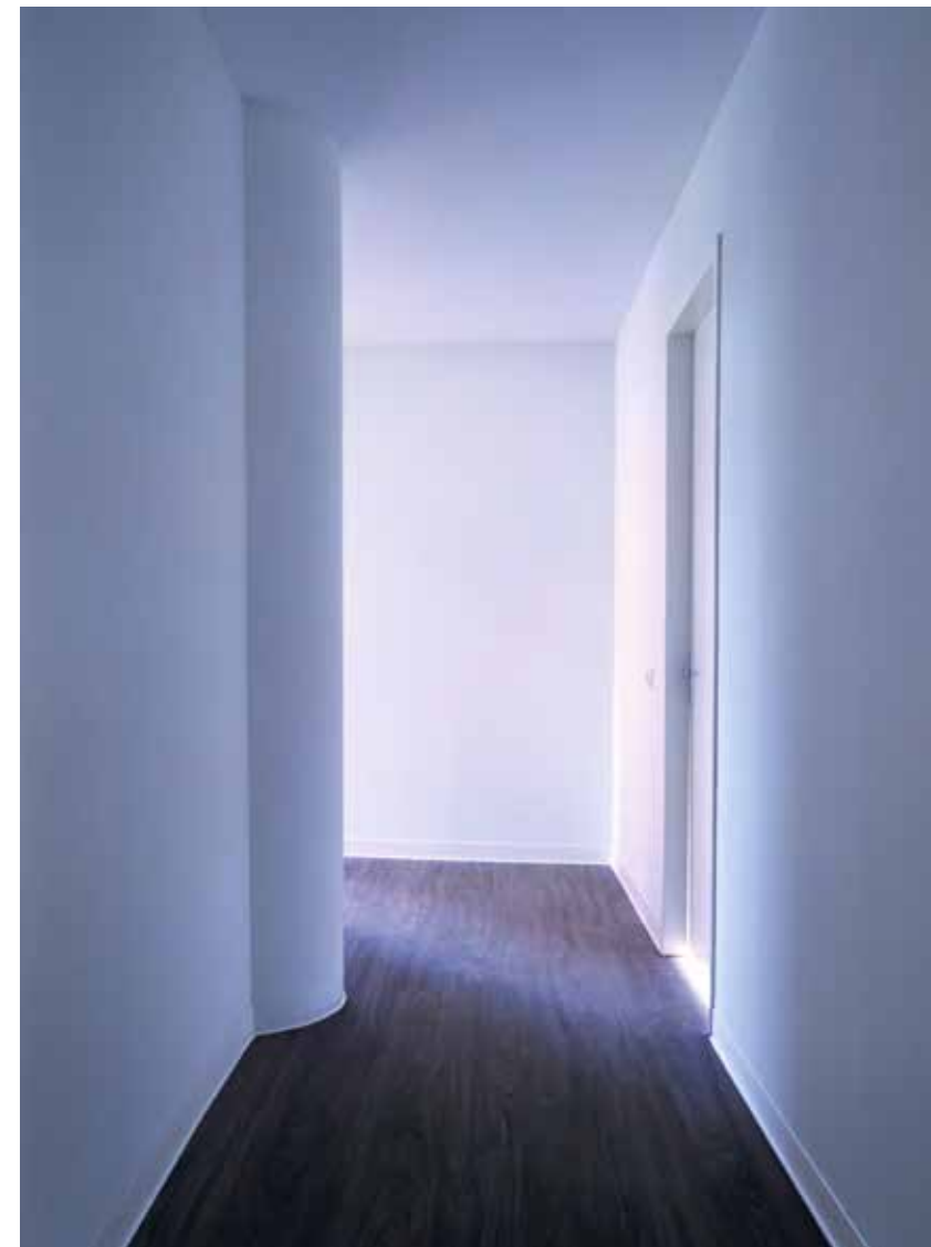
Higher Ground II-01, 2023